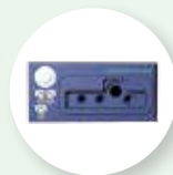
3 clavijas-Bovie monopolar N.º 20140-622