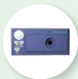
6 mm electrodo neutro N.º 20140-640