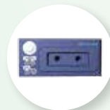
2 clavijas-22 mm bipolar N.º 20140-612