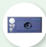
2 clavijas electrodo neutro N.º 20140-641