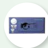
6 mm-2 clavijas electrodo neutro N.º 20140-642