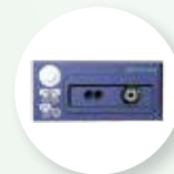
2 clavijas-22-28-8/4 mm, bipolar N.º 20140-613