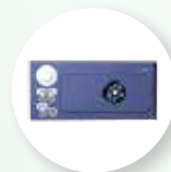
Multifuncional N.º 20140-630 (solo VIO 300 D)