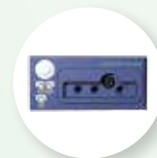
3 clavijas-9/5 mm, monopolar N.º 20140-623