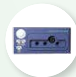
3 clavijas-9/5 mm, monopolar N.º 20140-623