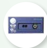
2 clavijas-22-28-8/4 mm, bipolar N.º 20140-613