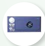
Multifuncional N.º 20140-630 (solo VIO 300 D)