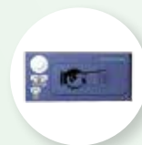
6 mm-2 clavijas electrodo neutro N.º 20140-642