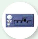
3 clavijas-Bovie monopolar N.º 20140-622