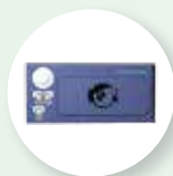
2 clavijas electrodo neutro N.º 20140-641