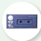
2 clavijas-22 mm bipolar N.º 20140-612