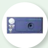
9/5 mm, monopolar N.º 20140-620