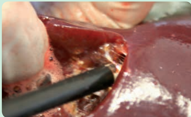
Диссекция тканей паренхимы в хирургии печени.